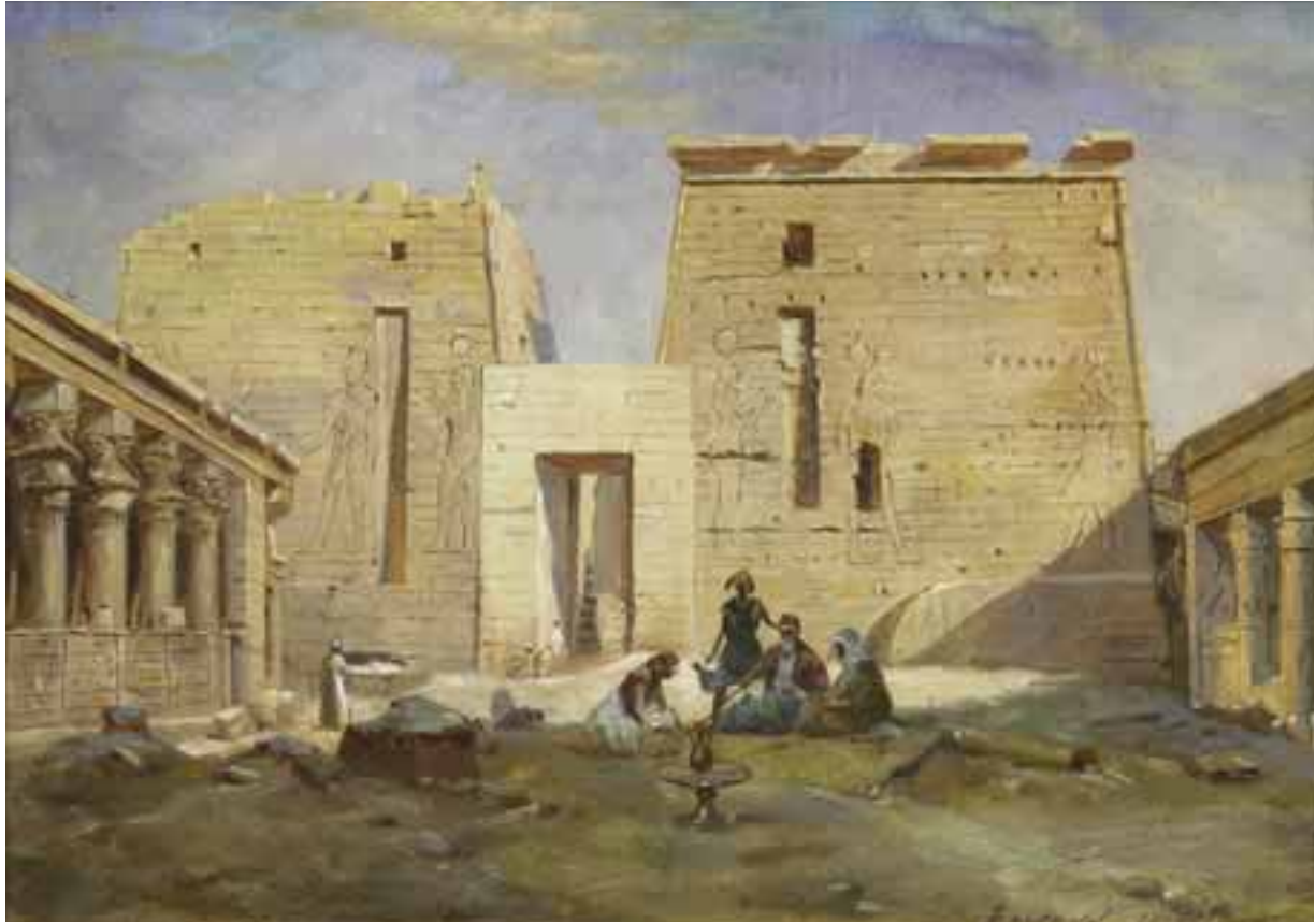
30 Edward WOOLM (Actif vers 1900) Vue d'un temple égyptien Toile 30 x 40 cm Signé en bas à droite Edward Woolm 1 000/1 500 €