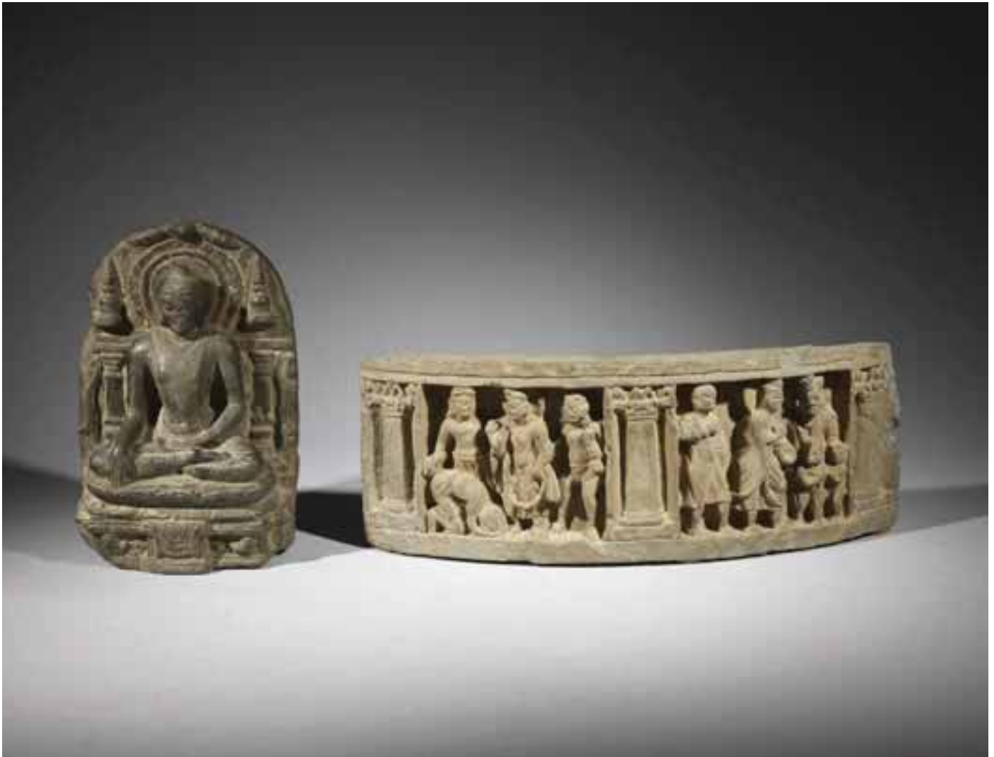
104 Inde, Bihar - X e /XI e siècle

Petite stèle en pierre noire, bouddha Sakyamuni assis en padmasana sur un socle en forme de lotus, les mains en bhumisparsha mudra (geste de la prise de la terre à témoin), devant une mandorle, flanquée d'une stupa sur chaque face surmontant une colonne. Inscription en sanskrit à l'arrière. (Accidents et restauration).