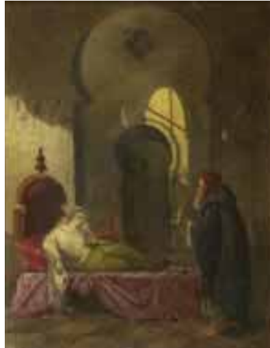
24 École orientaliste Odalisque au repos et serviteur

Dessin à l'encre et crayon sur papier signé en bas à droite indistinctement 31 x 23 cm 200/300 €