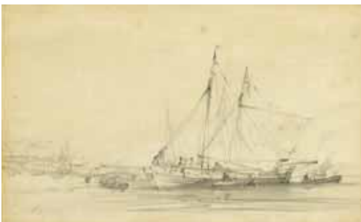
26 Eugène ISABEY (1804-1886) Voilier

Dessin à la plume et au pastel porte le cachet de la signature en bas à gauche 24 x 27 cm 300/400 €