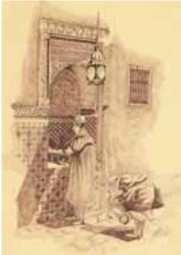
23 École orientaliste Le hammam

Dessin à l'encre et crayon sur papier signé en bas à droite indistinctement 31 x 23 cm 200/300 €