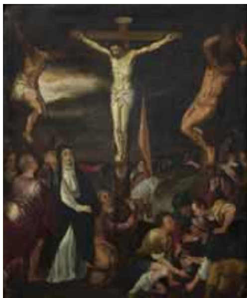
1 École FLAMANDE du XVII e siècle, suiveur de Louis de CAULLERY

La Crucifixion Huile sur cuivre 28 x 34 cm