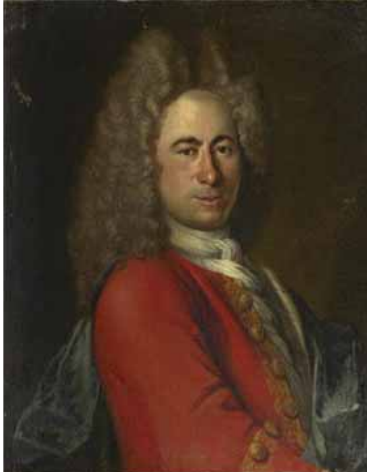
17 École allemande du XVIII e siècle Portrait d'homme en habit rouge Toile 72 x 56 cm (Sans cadre) 600/800 €