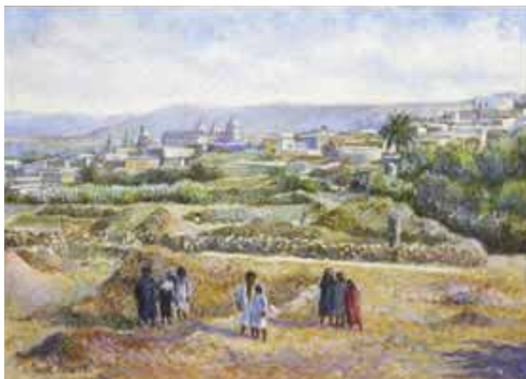
47 Hugues-Claude PISSARRO (né en 1935) Aux champs, paysage animé Pastel, signé en bas à gauche 36,5 x 50 cm 1 500/1 800 €