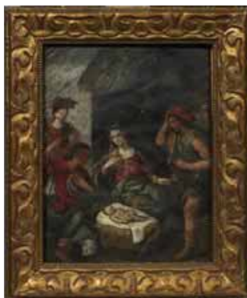
2 École Italienne vers 1630, suiveur de SARACENI

Nativité Huile sur cuivre 21 x 16 cm (Accidents et manques) 200/300 €