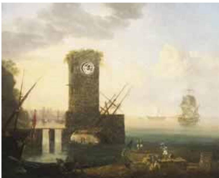
121 École française de la première moitié du XIX e siècle Tableau horloge